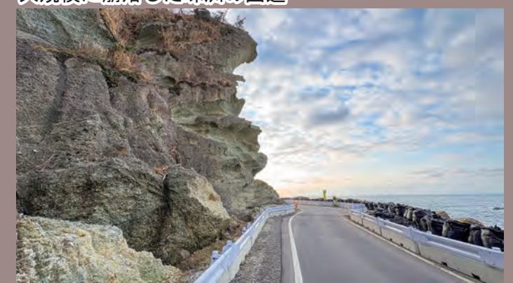
大規模に崩落した珠洲の国道