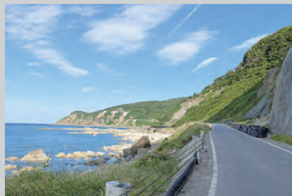
間垣の里 大沢・上大沢