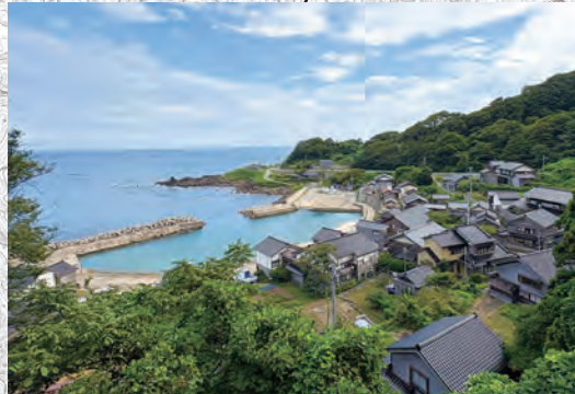
道路から見下ろす港町 黒瓦の集落と静かな港が、 素朴な日本の美を呼び覚ます