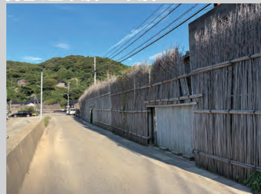
厳しい気象と共存してきた先人たちの生活の知恵を垣間見ることができる