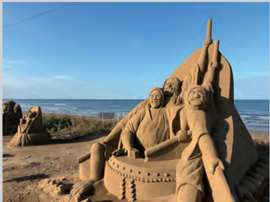
千里浜海岸の砂を固めて制作された 巨大なサンドアートは圧巻！