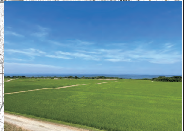
水田の緑とその先に広がる海の青が 織りなす爽やかな眺望