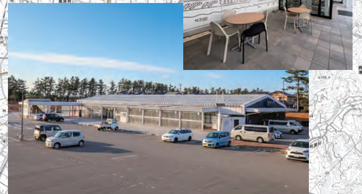
羽咋と能登の「いい」がギュギュっと 詰まった道の駅 源泉掛け流しの足湯で疲れを癒せる