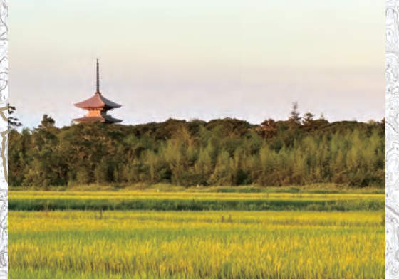
田園の向こうに佇む北陸随一の五重塔 自然と調和したその姿に心が落ち着く