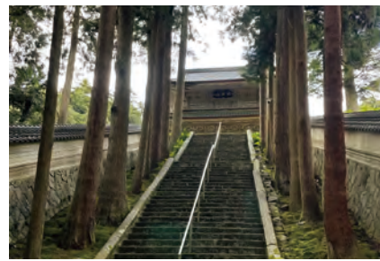
⑥ 永光寺(ようこうじ)