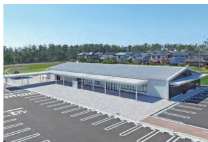
⑤ 道の駅 のと千里浜