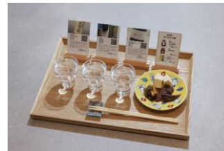
日本酒セット（おつまみ付）