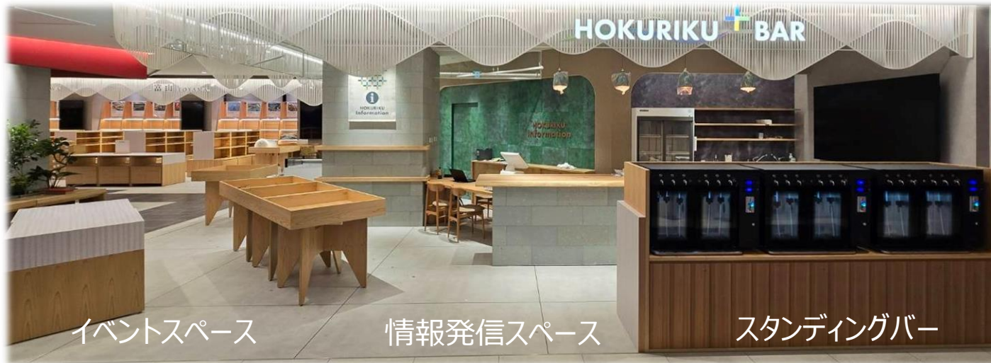
イベントスペース