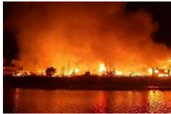
輪島市河井町地内

1次避難所： 91人 2次避難所： 86人(ホテル、旅館等) 広域避難所： 21人