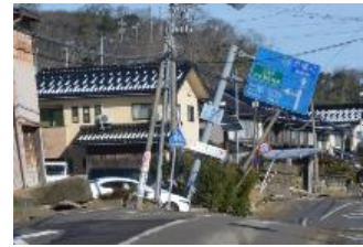
内灘町西荒屋地内 (液状化)